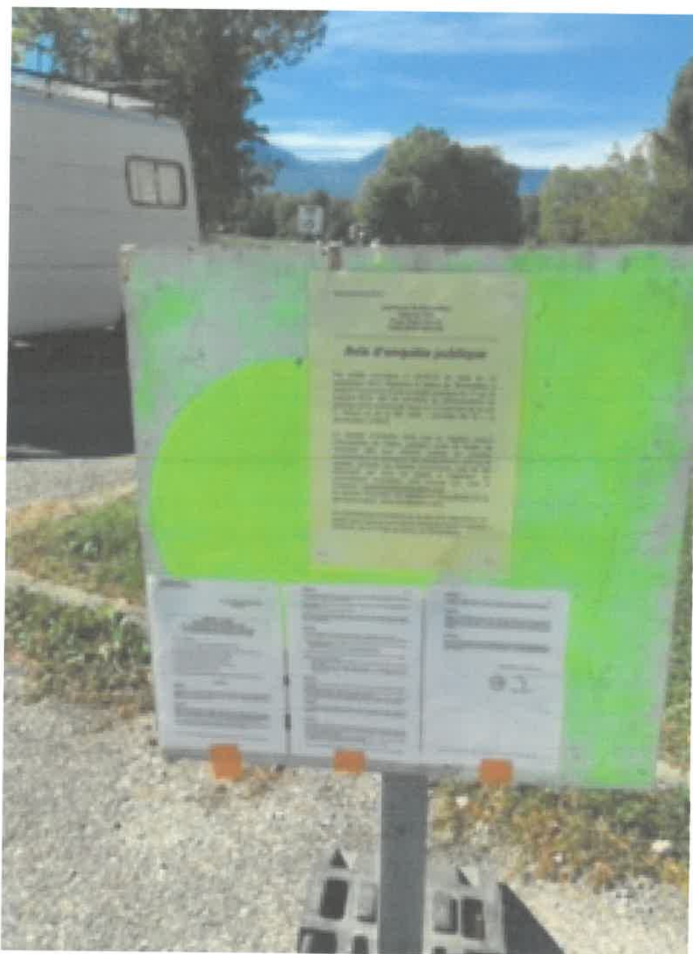
PLANCHE 1- AFFICHAGE AU DROIT DU PARKING